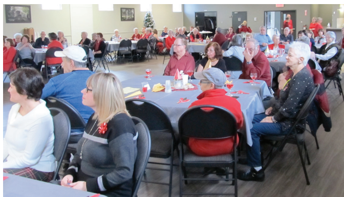
Souvenir d'avant la pandémie - Dîner de Noël 2019