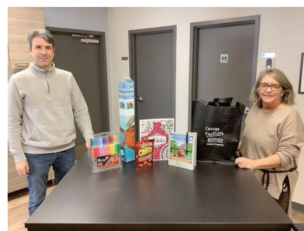
Projet trousse pandémie

Les services offerts en soutien à domicile :